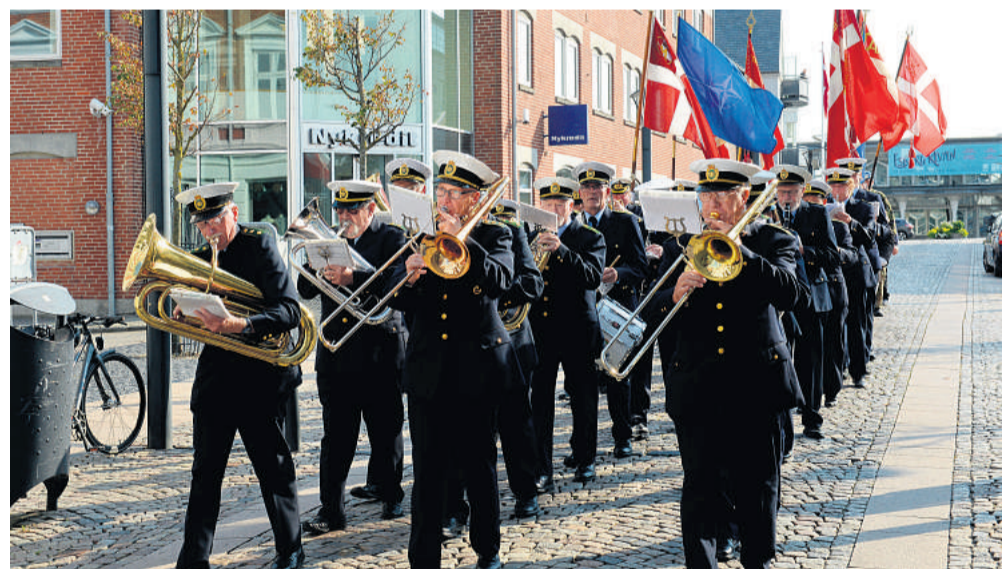
Politiorkesteret spillede, da cafeen åbnede.

Veterancafeen holder åbent onsdag i tidsrummet 16 til 21, hvor veteranerne og deres pårørende kan komme til en kop kaffe og/eller et aftensmåltid. Det er også planen, at der vil blive arrangeret udflugter. Alle aktiviteter arrangeres af frivillige og gennemføres på de præmisser, veteranerne opstiller.